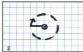
2. Pique ton compas sur ce point et trace un cercle.