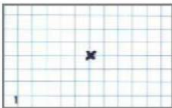
1. Marque un point.