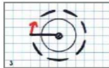
3. Augmente l'écartement du compas. Pique la pointe sur le même point et trace un nouveau cercle un peu plus grand.