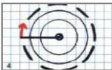
4. Augmente l'écartement du compas. Pique la pointe sur le même point et trace le dernier cercle encore plus grand.

Si tu as réussi ton tracé dans le cahier de brouillon, tu peux essayer de faire la même chose sur une feuille blanche.