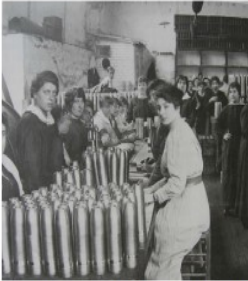
Les femmes au travail dans une usine d'armement.