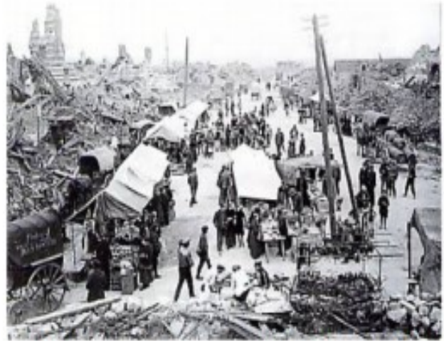
La ville de Lens en France en 1919, Histoire CM, cycle 3, Hatier

En regardant ces deux photos, explique à ton avis, quelles conséquences la guerre a sur les populations civiles. ----- -----