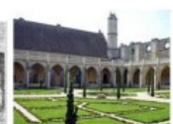
l'abbaye de Royaumont