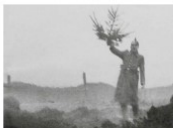
Un officier allemand sortant des tranchées en direction des positions britanniques

Alors certaines tranchées ont commencé à s'illuminer et les sapins ont décoré un instant ces paysages anéantis par les tirs d'obus.