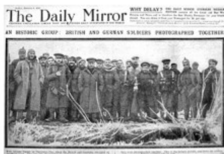
Une du quotidien The Daily Mirror en date du 5 janvier 1915, à propos de la "Trêve de Noël 1914"

Les soldats ne se sont pas contentés d'échanger des chants ou des sapins .... Ils se sont réellement rencontrés et ont partagé ensemble, des cigarettes, de l'alcool, du chocolat, du saucisson ..... et ils se sont même offerts des petits cadeaux.