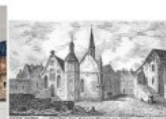
Les Quinze-vingt au Moyen Âge