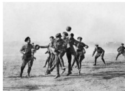
Soldats anglais, écossais et allemands se livrant à une partie de football près d'Ypres

A la fin des matchs, des poignées de main se sont échangées entre les équipes adverses.