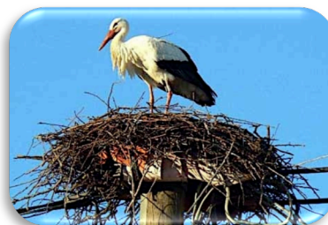
Le nid gigantesque

La cigogne blanche se nourrit essentiellement de petits animaux comme des vers de terre, des souris, des insectes, des grenouilles, des lézards.