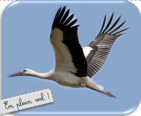
En plein vol !