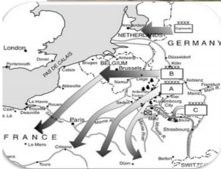
La bataille de France ou la guerre éclair

Devant eux, les populations épouvantées fuyaient : longues