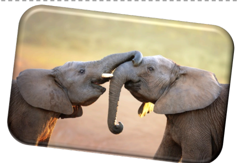
L'éléphant barrit !