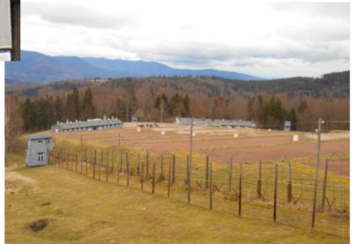
Camp de concentration du Struthof, Natzweiler, Alsace

« On arrivait à Auschwitz-Birkenau dans la nuit. La rampe était éclairée par de puissants projecteurs. [...] Poussés brutalement hors des wagons par des hommes en tenue de bagnards, nous étions affolés par les cris, les aboiements des chiens. Tout de suite, les SS, aidés de déportés, nous faisaient mettre en rang afin de séparer ceux qui allaient entrer dans le camp de ceux qui iraient dans la chambre à gaz.