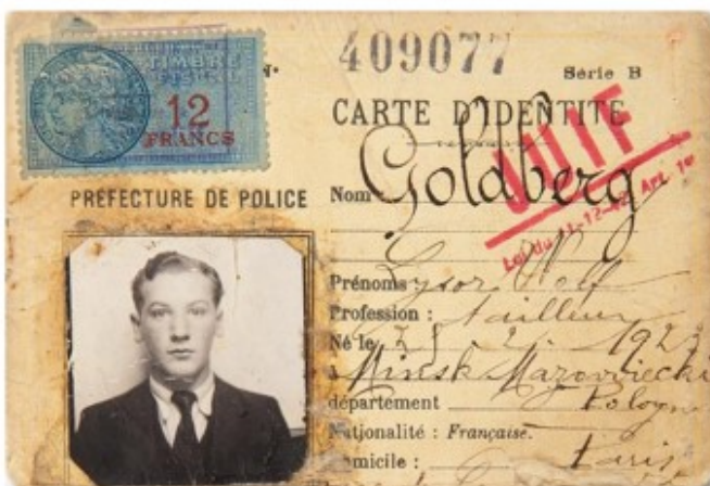
Carte d'identité d'une personne juive

Hitler défend une idéologie raciste et antisémite. Selon lui, les Juifs et les Tziganes sont des êtres inférieurs qu'il faut éliminer car ils menacent la pureté de la « race » allemande qu'il estime supérieure. Dès leur arrivée au pouvoir en Allemagne en 1933, les nazis mènent une politique antisémite : les Juifs n'ont plus le droit d'exercer certains métiers comme médecin ou journaliste, de fréquenter certains lieux publics (les écoles, les cinémas, les théâtres) ou de se marier avec des personnes non juives. Ils doivent porter une étoile jaune et sont rassemblés dans des ghettos ou des camps de concentration. Cette politique s'étend aux territoires conquis ou occupés par l'Allemagne, notamment en Pologne. D'autres populations, comme les handicapés, les homosexuels, sont aussi victimes de la répression nazie. Dans la France occupée, le gouvernement du maréchal Pétain collabore avec l'Allemagne et promulgue aussi des lois antisémites à partir de 1940.