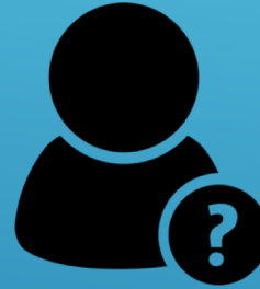
Un enseignant complétant le service

- Une classe à double niveau : il est très probable que les CP de l'année prochaine soient répartis en deux classes de CP-CE1 comme cette année. Le programme sera un vrai programme de CP, et les apprentissages seront les mêmes quelle que soit la classe et quel que soit l'enseignant.